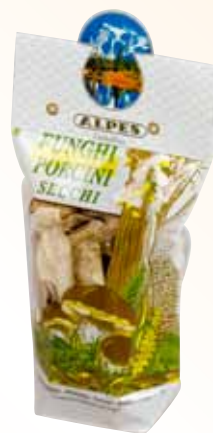
Sacchetto da 100g Qualità Speciale