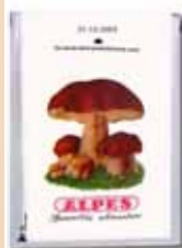
Busta da 15g Qualità Speciale

I migliori Funghi porcini, accuratamente selezionati ed essiccati con un processo che mantiene inalterato l'inconfondibile profumo. Controllati da Esperto Micologo e confezionati in buste e sacchetti di differenti capacità, per soddisfare qualsiasi necessità.