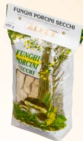
Sacchetto da 500g Qualità Speciale