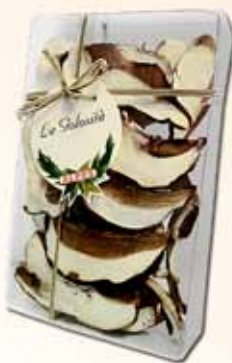
Astuccio da 30g Qualità Extra