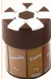
Il droghiere gr./net 47g. Spargitore a 6 scomparti contenente: curry, pepe nero, peperoncino, pepe bianco, cannella, aglio.