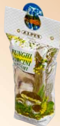
Sacchetto da 50g Qualità Speciale