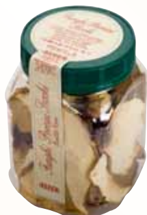
30g Flacone PET Qualità Extra