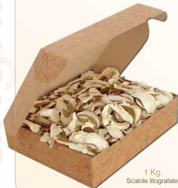
1 Kg Scatole litografate