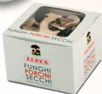
Astuccio quadrato da 40g Qualità Speciale