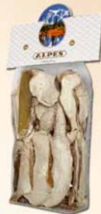
Sacchetto da 50g Qualità Extra